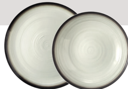
Suppenteller rund 21 cm Soup plate round 8.3 inch