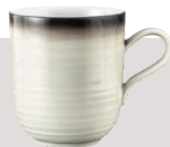
Becher mit Henkel 0,40 ltr. Mug with handle 13.5 oz.