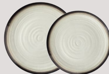
Frühstücksteller rund 22,5 cm Plate flat round 8.6 inch