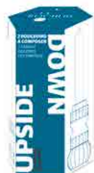
Set de 2 bougeoirs UPSIDE DOWN bleu hirondelle 2

H : 5,5 cm ø : 6,9 cm visuel non contractuel