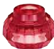
Bougeoir DOWN cerise 2

H : 5,5 cm ø : 6,9 cm visuel non contractuel