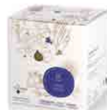
Jardin d'hiver aux notes de cardamome, noix de coco, orange...

6449 48 H : 9,4 cm ø : 8,1 cm 39.00LR16.50 €1