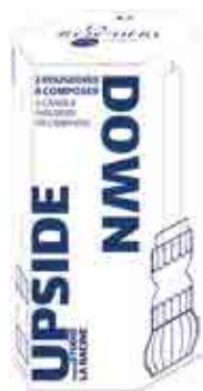
Set de 2 bougeoirs UPSIDE DOWN transparent 2

6477 01 H : 10,8 cm ø : 6,9 cm 10.60LR25.90 2