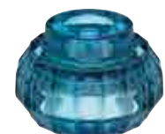
Bougeoir DOWN bleu hirondelle 2

H : 5,5 cm ø : 6,9 cm visuel non contractuel