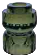
Bougeoir UPSIDE vert olive 2