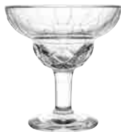
Verre à cocktail

6481 01 H : 9,3 cm ø : 8,4 cm Cl : 34 / Oz : 11,99 3.20LR7.90 ☞6