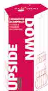
Set de 2 bougeoirs UPSIDE DOWN cerise 2

H : 5,5 cm ø : 6,9 cm visuel non contractuel