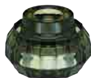
Bougeoir DOWN vert olive 2

H : 5,5 cm ø : 6,9 cm visuel non contractuel