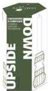
Set de 2 bougeoirs UPSIDE DOWN vert olive 2

H : 5,5 cm ø : 6,9 cm visuel non contractuel