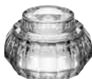
Bougeoir DOWN transparent 2