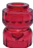
Bougeoir UPSIDE cerise 2

6477 97 H : 10,8 cm ø : 6,9 cm 12.40LR29.90 📦2