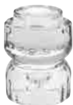
Bougeoir UPSIDE transparent 2

They're highly versatile, designed to hold three different types of candle: tea lights, taper candles or elegant tapered candles.