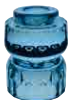
Bougeoir UPSIDE bleu hirondelle 2

6477 25 H : 10,8 cm ø : 6,9 cm 12.40LR29.90 📦2